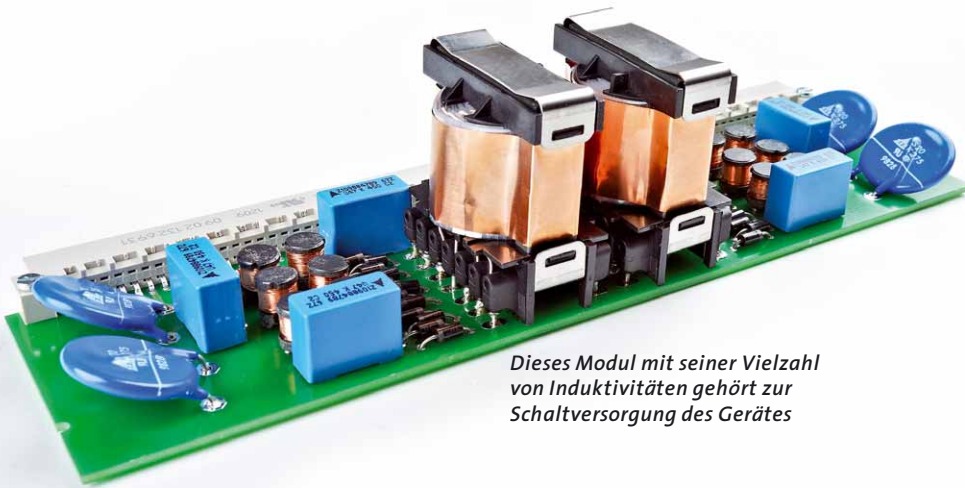
Dieses Modul mit seiner Vielzahl von Induktivitäten gehört zur Schaltversorgung des Gerätes